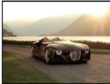
BMW 328 HOMMAGE