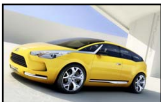
Le concept : Citroën C-Sportlounge