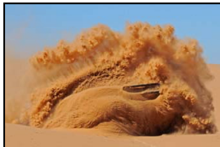
2010, Marchand de sable – Vargiolu