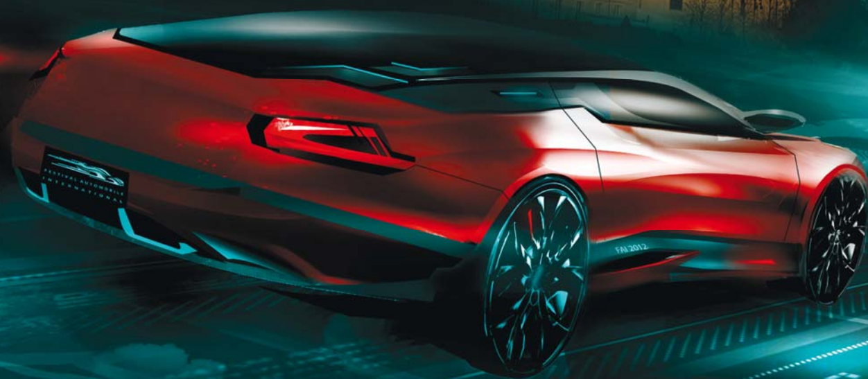
Illustration concept car et visual development: Gary Sanchez