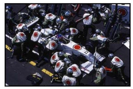
2000, Magny Cours - Levent