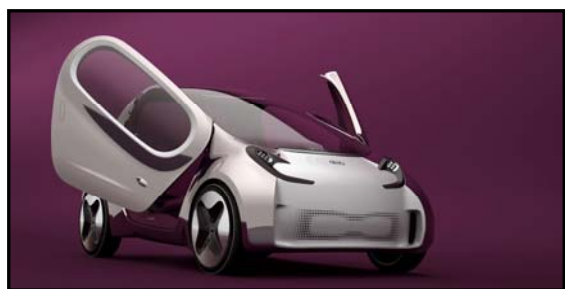
Le concept Kia Pop