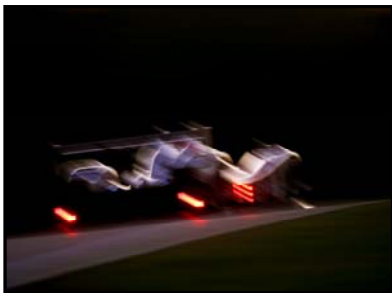
2008, Road Atlanta – Flamand

Les visiteurs peuvent donc admirer les tirages grand format de toutes les photos signées DPPI ayant remporté le Grand Prix de la Plus Photo, de 1986 à nos jours.