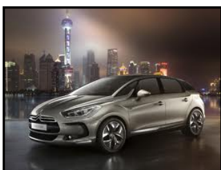
La réalité : Citroën DS5