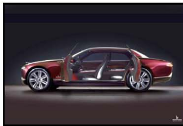
BERTONE Jaguar B99