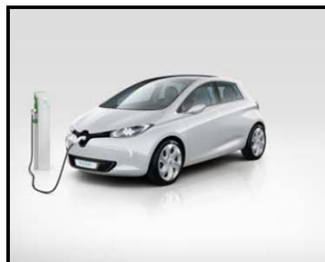
RENAULT ZOE PREVIEW