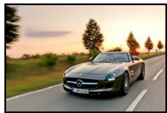
MERCEDES SLS ROADSTER

Si le Festival aime à faire admirer les plus belles créations du moment au public, il souhaite aussi lui expliquer la raison d'exister de ces voitures éditées en un exemplaire unique et très peu connues en dehors du milieu des spécialistes.