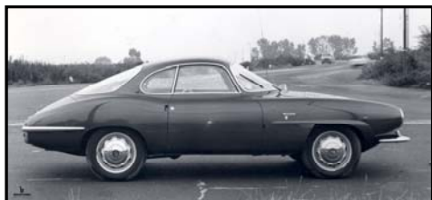
BERTONE Alfa Roméo Giulia SS

D'autres voitures d'exception sont également exposées. Elles représentent ces voitures que nous pouvons croiser tous les jours, ou qui nous font rêver, mais qui sortent toutes de l'esprit de designers de génie, d'hier ou d'aujourd'hui.